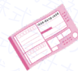
郵送伝票 (お客様ご記入用)